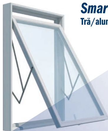
Smartline 115 Trä/aluminium