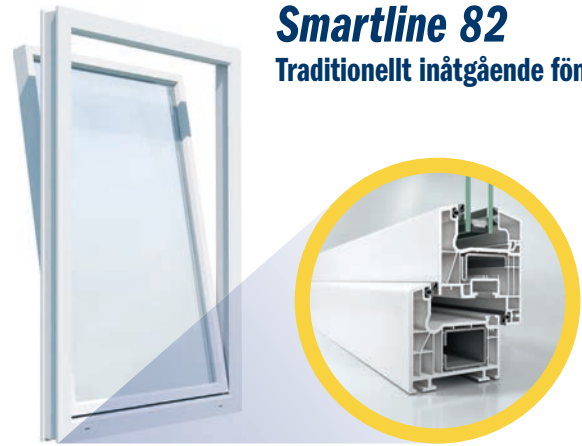
Smartline 82 Traditionellt inåtgående fönster