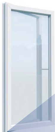
Smartline 82 Traditionellt utåtgående fönsterdörr